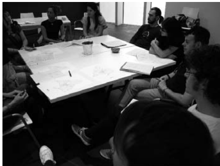
Fig. derecha: Presentación de resultados