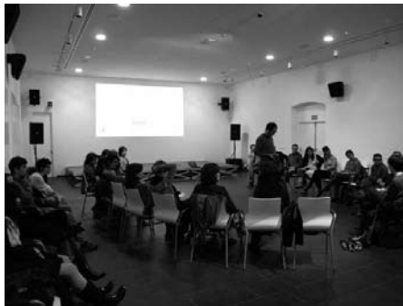
Fig. derecha: Sesión de expertos: Nerea Campillo-Arquitecto In the Air Uriel Figué-Arquitecto UHF Ariadna Cantis-Arquitecto Fresh Madrid