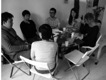
Fig. derecha: Sesión de trabajo en CA2M