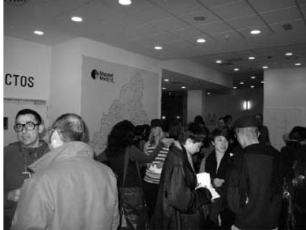
Fig. derecha: Sesión de trabajo en CA2M