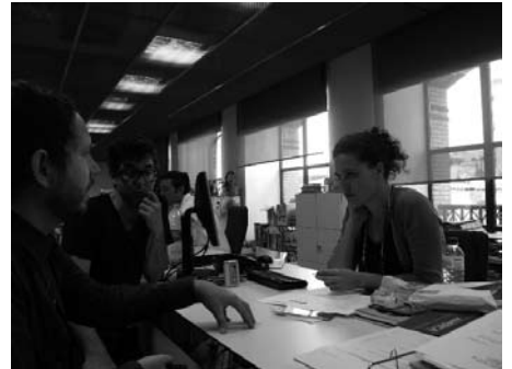
Fig. izquierda: Sesión de laboratorio en CA2M